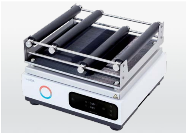
Agitadores robustos de nivel básico con control digital: Varioshake VS 8 O y VS 8 B

Los agitadores LAUDA Varioshake destacan por su alta calidad, su gran durabilidad y su absoluta fiabilidad. Su sistema mecánico es robusto y está sometido a poco desgaste, lo cual permite un funcionamiento especialmente silencioso y una operación continua con gran fiabilidad. Tanto para realizar mezclas suaves o agitar vigorosamente, los agitadores Varioshake y sus accesorios a medida son siempre la solución ideal.