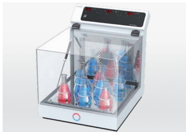
Varioshake VS 60 OI: compacto, económico y potente

Sencillas, compactas o robustas con varios niveles de agitación: las incubadoras con agitación LAUDA Varioshake son especialistas en la mezcla y la agitación con movimientos circulares reproducibles de forma exacta y temperaturas de hasta 70 °C. Triunfan por su distribución óptima de la temperatura en todo el espacio útil y su gran funcionalidad.