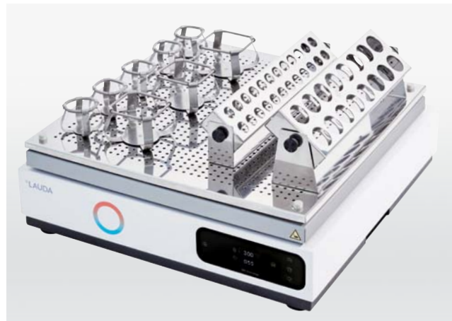
Moderno control digital y funciones ampliadas: Varioshake VS 15 O y VS 15 B